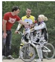
Bitte Bild anklicken!

ERLANGEN - Zum ersten Mal in der Vereinsgeschichte hat der RC 50 Erlangen eine Deutsche Meisterschaft ausgerichtet. Das 60-jährige Vereinsjubiläum und die hervorragende Bahn an der Spardorfer Straße, die eine der schönsten in Deutschland ist, waren ausschlaggebend für diese hohe Ehre. Rund 450 Fahrer aus der ganzen Republik kämpften um die 25 zu vergebenden Titel. Die Erlanger Fahrerinnen und Fahrer holten sich fünf Deutsche Meistertitel.