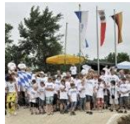
Bitte Bild anklicken!

Die Erlanger erhofften sich durch diese besondere Schwierigkeit einen kleinen Heimvorteil, konnten sie doch ausgiebig auf dem neuen Kurs trainieren. Aber für die vielen Spitzenfahrer aus der ganzen Republik, die am Start waren, ist das nicht wirklich ein Nachteil gewesen: Das belegen die Rennergebnisse.