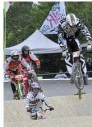
Bitte Bild anklicken!

800 Zuschauer bejubeln Fahrer bei den Deutschen BMX-Meisterschaften